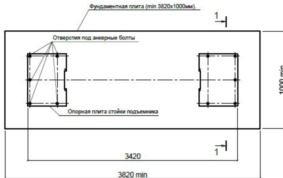
Схема расположения фундаментных болтов Т-4